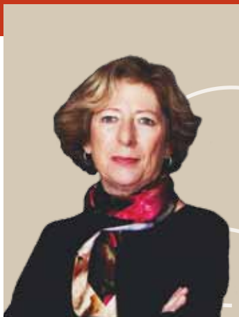
Geneviève Fioraso, ministre de l'Enseignement supérieur et de la Recherche