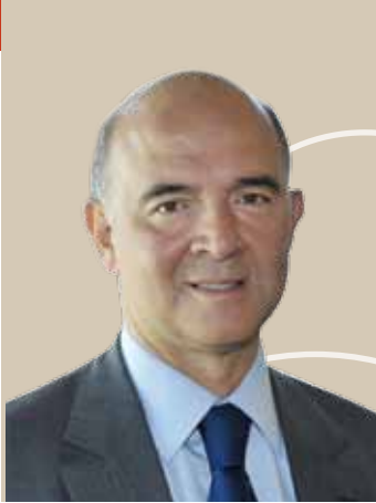
Pierre Moscovici, ministre de l'Économie et des Finances